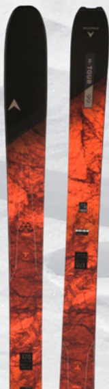
TOUR-PERFORM + FREETOUR