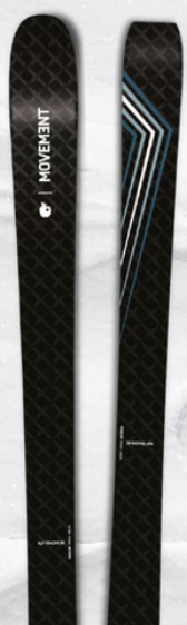
TOUR- NÍZKÁ VÁHA

* Délka lyže, při které byl měřen radius, váha a krojení